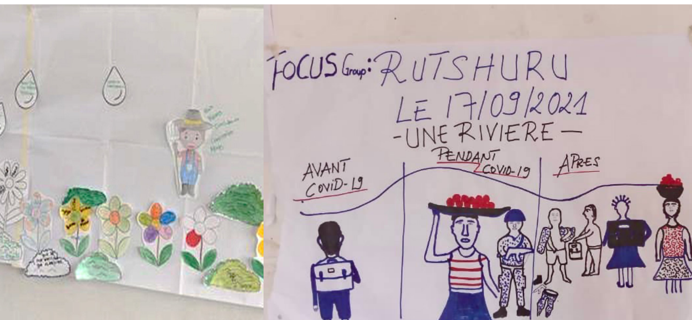
Figura 1. Los métodos adaptados a los niños incluyeron actividades reflexivas participativas: (izquierda) Dibujo del “Jardín de la vida”: estudiantes de primaria en Colombia comparten su experiencia sobre el cierre de escuelas, el apoyo que experimentaron y sus esperanzas e ideas para el futuro; (derecha) “Cronología del río”: estudiantes de secundaria en Mweso describen su experiencia antes, durante y después del cierre de las escuelas por el COVID-19.